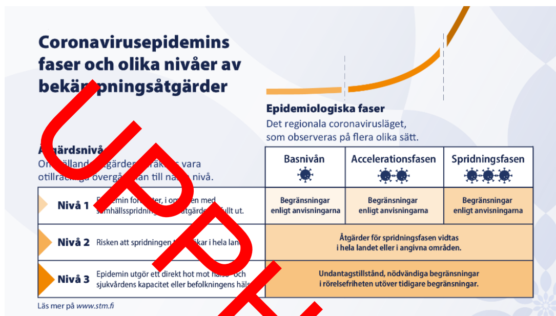
Bild 5. Coronavirusepidemins faser och bekämpningsåtgärdernas nivåer och nya temporära befogenheter i lagen om smittsamma sjukdomar

På nuvarande nivå 1 har strängare rekommendationer än de grundläggande rekommendationer som behandlats ovan tillämpats på begränsningen av offentliga tillställningar. Dessa är en absolut deltagargräns på 50 personer på basnivån och en deltagargräns på 20 personer i accelerationsfasen. På åtgärdsnivåerna 2-3 som beskrivs i kompletteringen tillämpas på grund av de offentliga tillställningarnas natur till vidare ännu dessa rekommendationer om begränsningen av offentliga tillställningar: