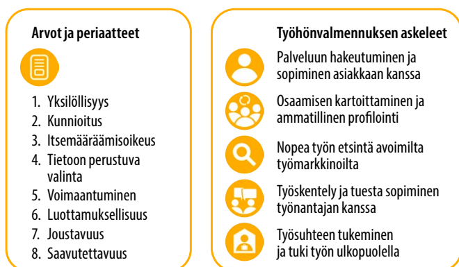
Kuvio 3. Laatukriteereihin perustuva tuetun työllistymisen työhönvalmennus.