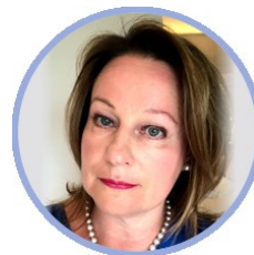
Virpi Hiltunen opetus- ja kulttuuriministeriö