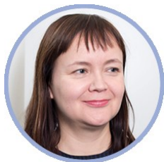
Eveliina Pöyhönen sosiaali- ja terveysministeriö