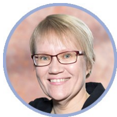
Milja Tiainen sosiaali- ja terveysministeriö