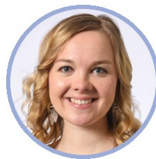
Katri Kulmuni Keskustan eduskuntaryhmä