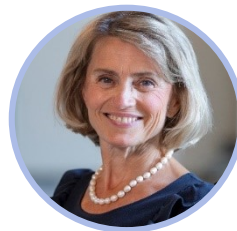
Päivi Räsänen Kristillisdemokraattinen eduskuntaryhmä