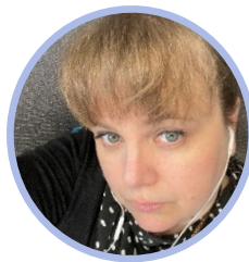
Ritva Liukonen sosiaali- ja terveysministeriö