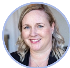
Pia Sillanpää Perussuomalaisten eduskuntaryhmä