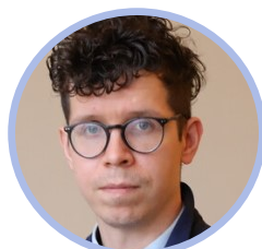
Simo Mentula valtiovarainministeriö