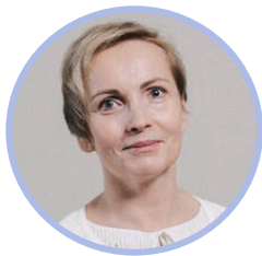
Ulla Härmäläinen valtiovarainministeriö