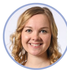
Katri Kulmuni Keskustan eduskuntaryhmä