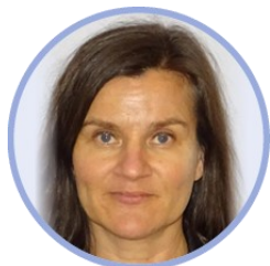
Eeva Vartio sosiaali- ja terveysministeriö