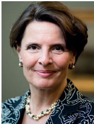
ANNE BERNER, FINLANDS SAMARBETSMINISTER

Det är 60 år sedan finska delegationen deltog i Nordiska rådets session för första gången. Mycket har blivit bättre under de 60 åren, men samtidigt kan vi också se att vi har nya frågetecken framför oss. Hur ska Norden och den nordiska modellen utvecklas i framtiden? Hur kan vi se till att den fria rörligheten, som är ett av de viktigaste värdena för Norden, kan behållas?